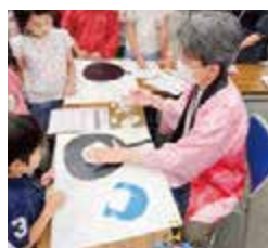
寝屋川第七中学校