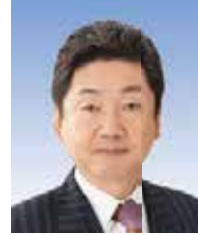
大阪府中小企業団体中央会会長