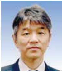
大阪府職業能力開発協会会長