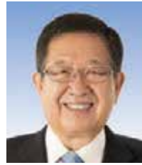
大阪広告美術協同組合 顧問 元衆議院議員

結びに、本年が皆様方にとり、栄えある輝かしい年になりますようご祈念申し上げ、新年のご挨拶とさせていただきます。