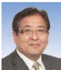
大阪広告美術協同組合顧問 大阪市議員